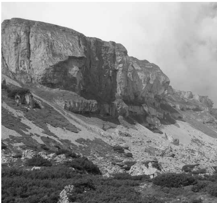
Hoher Ifen - Kleinwalsertal