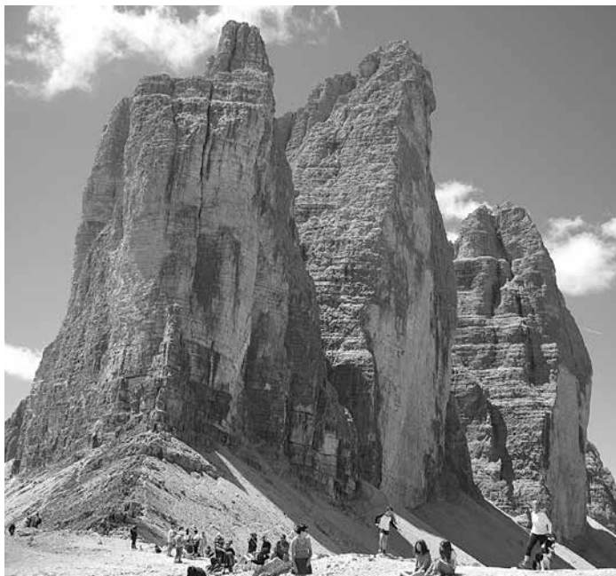
Drei Zinnen - Dolomiten